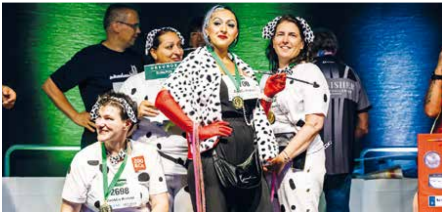
Kreativstes Outfit – Platz 1.