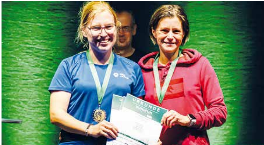
Das schnellste Frauen Team.