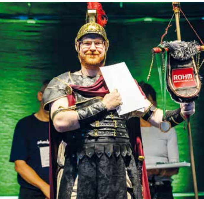
Kreativstes Outfit – Platz 3.