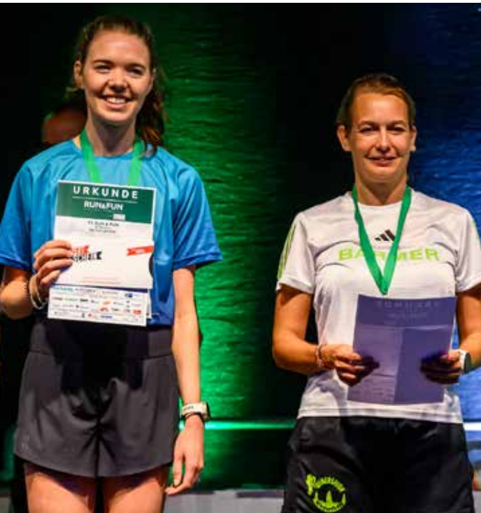
Die schnellsten Frauen.