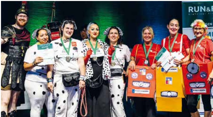
Die kreativsten Outfits.