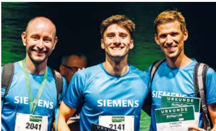
Die schnellsten Männer.