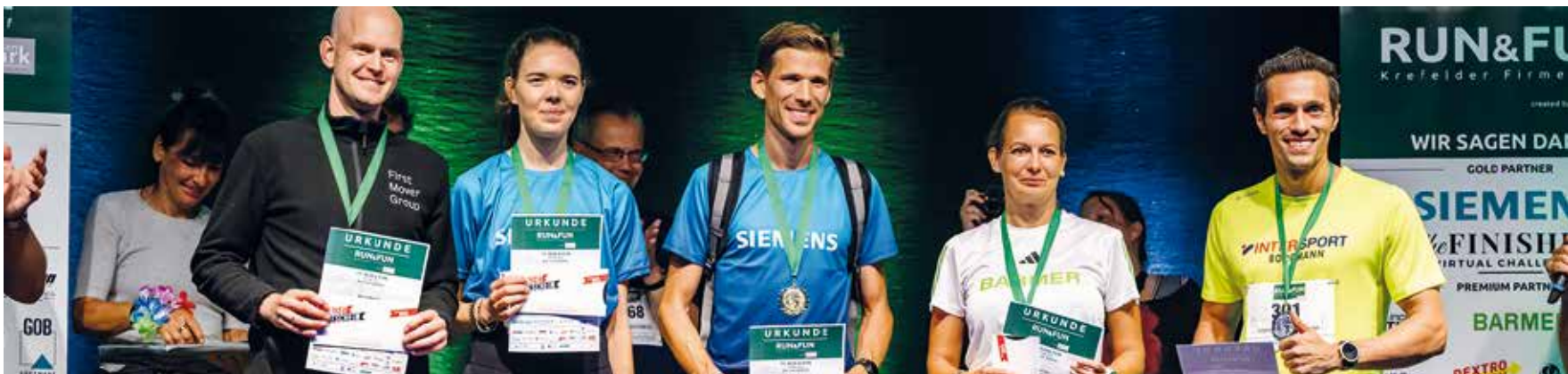
Die schnellsten Frauen und Männer.