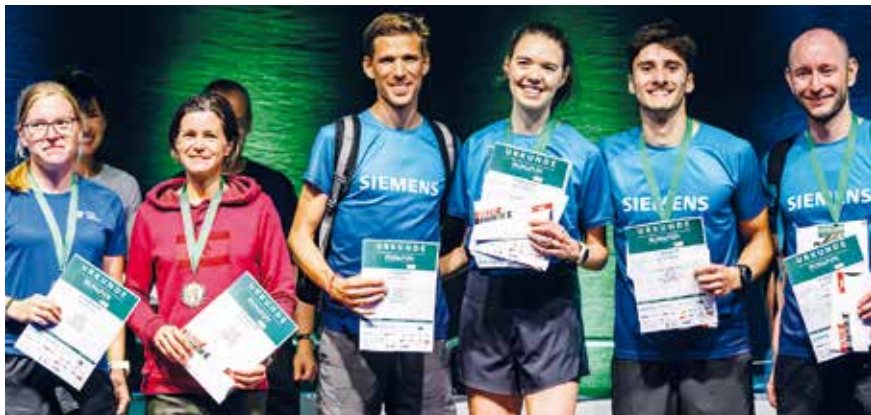
Die schnellsten Teams.