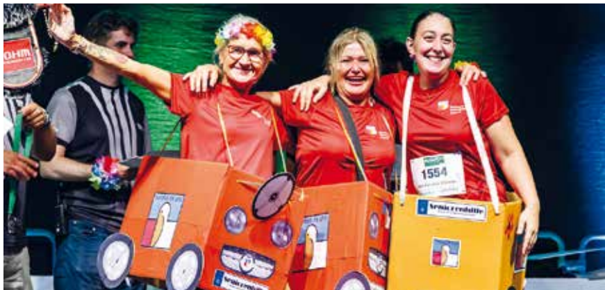
Kreativstes Outfit – Platz 2.