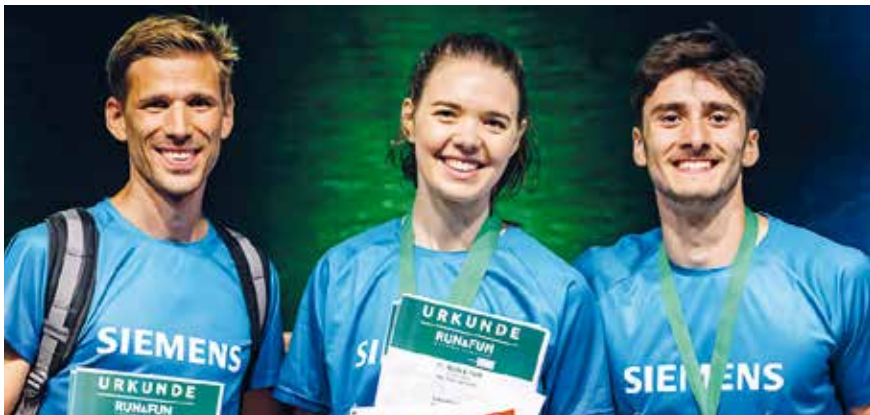
Das schnellste Mixed Team.